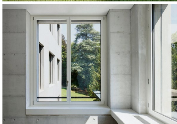
Schule Kreuzbühl: Der Neubau nimmt Rücksicht auf die benachbarten denkmalgeschützten Villen und verbreitet eine Stimmung, in der man gerne Schüler ist